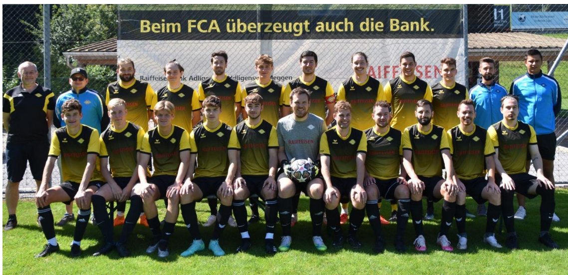
Die erste Mannschaft des FC Adligenswil