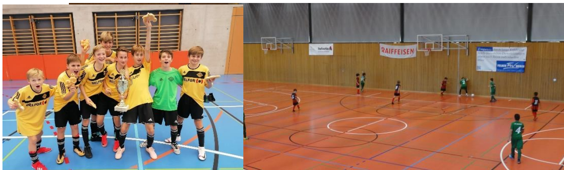
FCA-Junioren feiern ihren Sieg am Hallenturnier und Blick in die 3-Fachturnhalle in Meggen

Alle Beträge in Schweizer Franken und inklusive Mehrwertsteuer