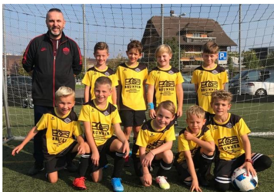
Ein Teil der F und G Junioren des FC Adligenswil