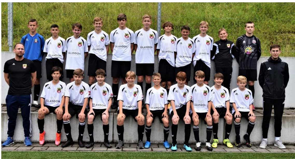
Gemeinsames Team mit Meggen

Der FC Adligenswil sucht die regionale Zusammenarbeit mit anderen Vereinen und Organisationen, die gleichgelagerte Ziele verfolgen.