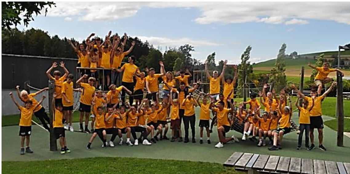
Ausflug im Juniorenlager