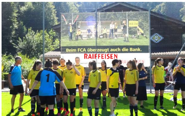
Hauptsponsor Raiffeisenbank Adligenswil - Udligenswil - Meggen

Alle Beträge in Schweizer Franken und inklusive Mehrwertsteuer.