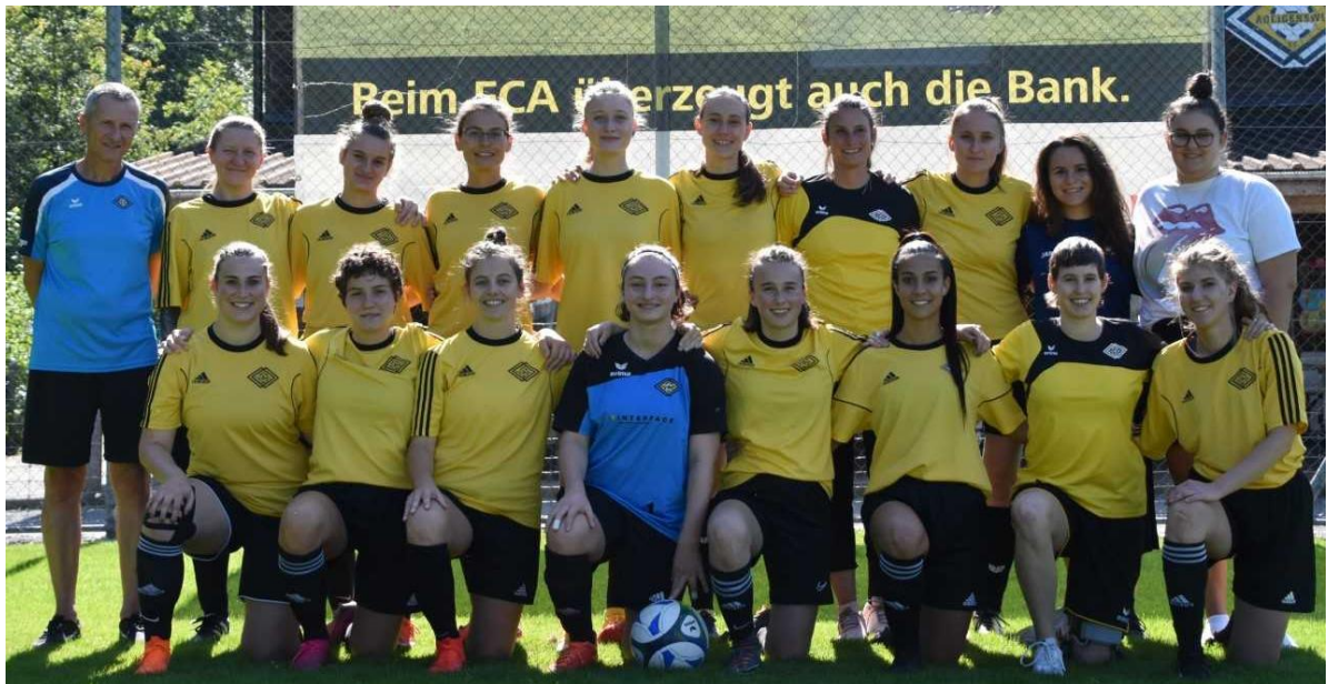
Das Frauen-Team des FC Adligenswil