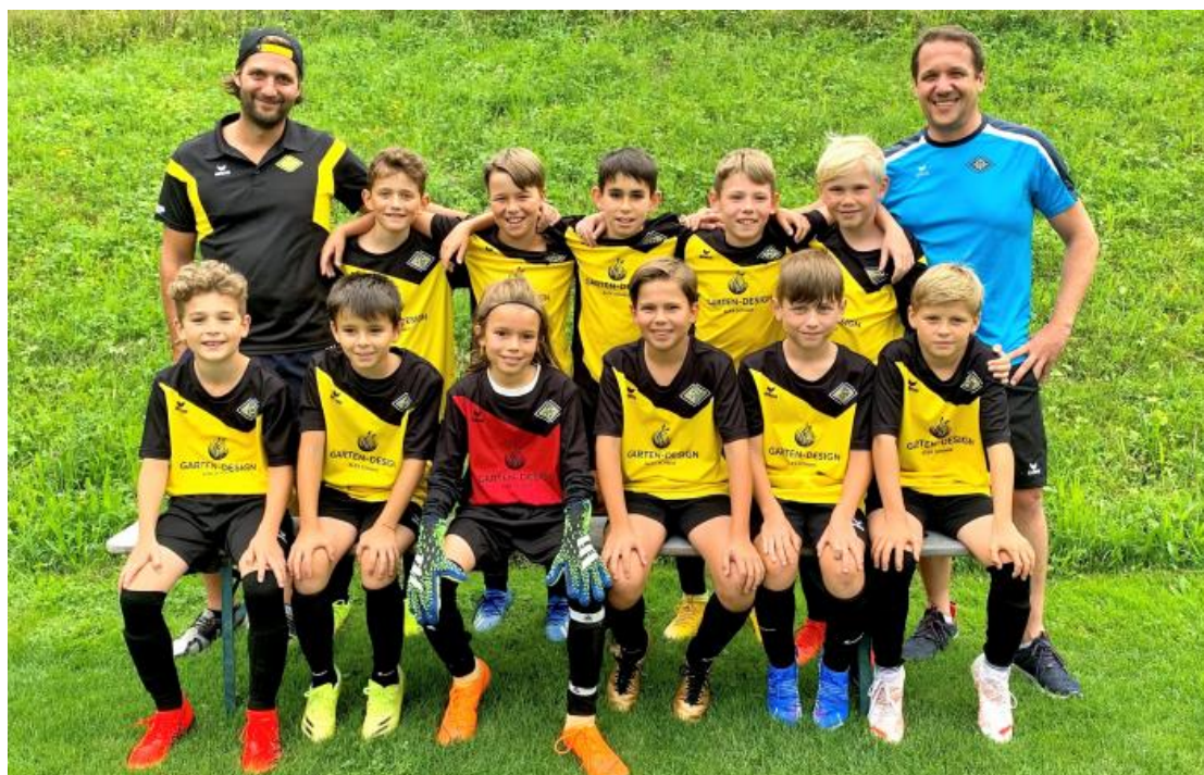
Ea-Junioren des FC Adligenswil; Aufdruck vierfarbig, Dress komplett mit Leibchen, Hosen und Stulpen

Alle Beträge in Schweizer Franken und inklusive Mehrwertsteuer