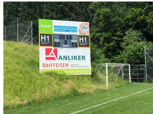
Bigsponsor H1 Businesspark Adligenswil